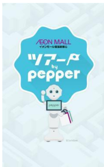
案内Webページ ビジュアルイメージ