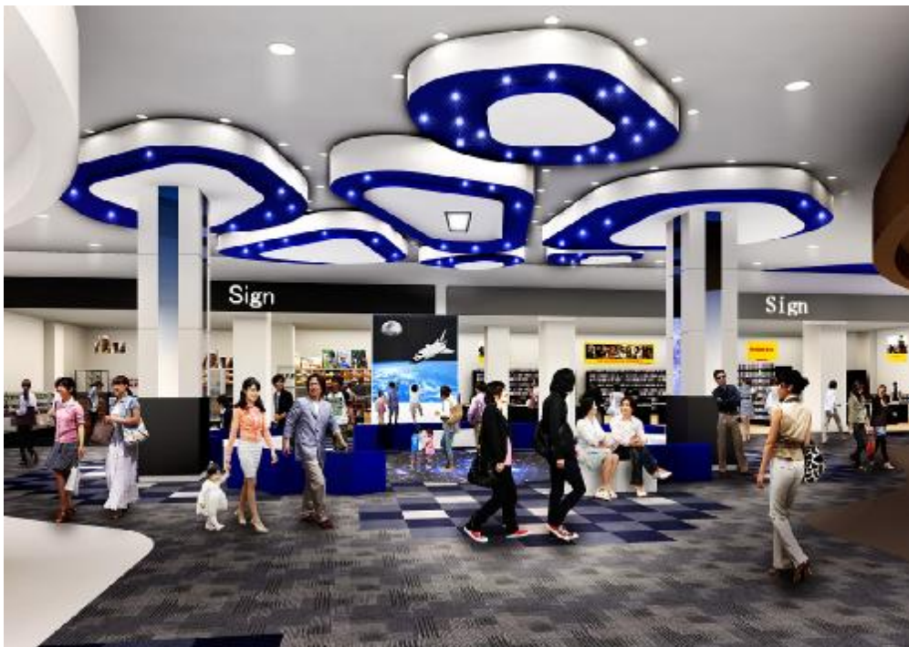
増床モール内 イメージ