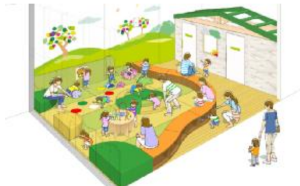
<キッズの遊び場を併設した授乳室>