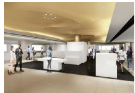
2階 ※イメージパース

2階のデザインモチーフは“沙（しゃ）”です。 シルクロード、遥か平城の都を目指し、范々として累々たる金の峰を超える様を表現しています。