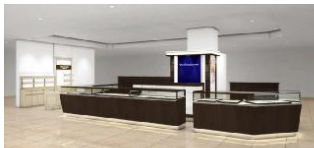
ヴァンドーム青山 ※パースイメージ