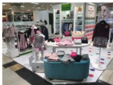
ケイト・スペード ニューヨーク