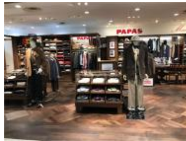
パパス・マドモアゼルノンノン