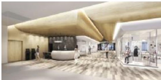
1階 中央通路 ※イメージパース

肉感的でスケールアウトした造形がつくるヴォリュームの美しさ、彼の時代に大和が残した美をたどります。