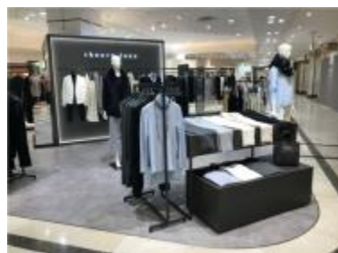
セオリーリュクス