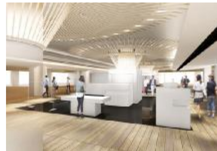
3階 ※イメージパース

3階のデザインモチーフは“傘（かさ）”です。 日本のディティールに見る趣と、美しさと共に傘の連なりに包まれます。