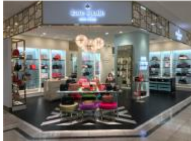
ケイト・スペード ニューヨーク