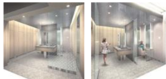
1階 パウダールーム ※イメージパース

私の“庵（いおり）”をテーマに女性に優しいパウダールームを1Fに新設いたしました。