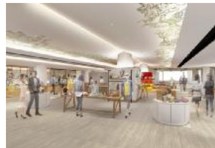
4階 ※イメージパース

4階のデザインモチーフは“旅路（たびじ）”です。 東の果てから終着の地までシルクロードを旅するらくだの絵巻を表現しています。