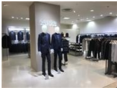
カルバンクラインプラティナム