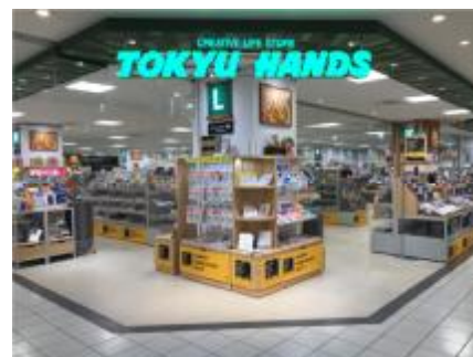
東急ハンズ奈良店

「東急ハンズ」事業のフランチャイズ形態直営事業化 第1号店舗であり、奈良県初出店となる「東急ハンズ奈良店」を新規導入