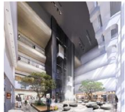
1階 施設吹き抜け（らくだ広場） ※イメージパース

らくだ広場には、新しいならファミリーを祝い、当施設の象徴である「ポコラ」（らくだのモニュメント）が装いも新たに帰ってきます。