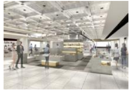
1階 ※イメージパース

1階のデザインモチーフは“格（ごう）”です。 質朴な趣の奈良の格天井が銀を纏い和洋新古独特の中世的なイメージを表現しています。