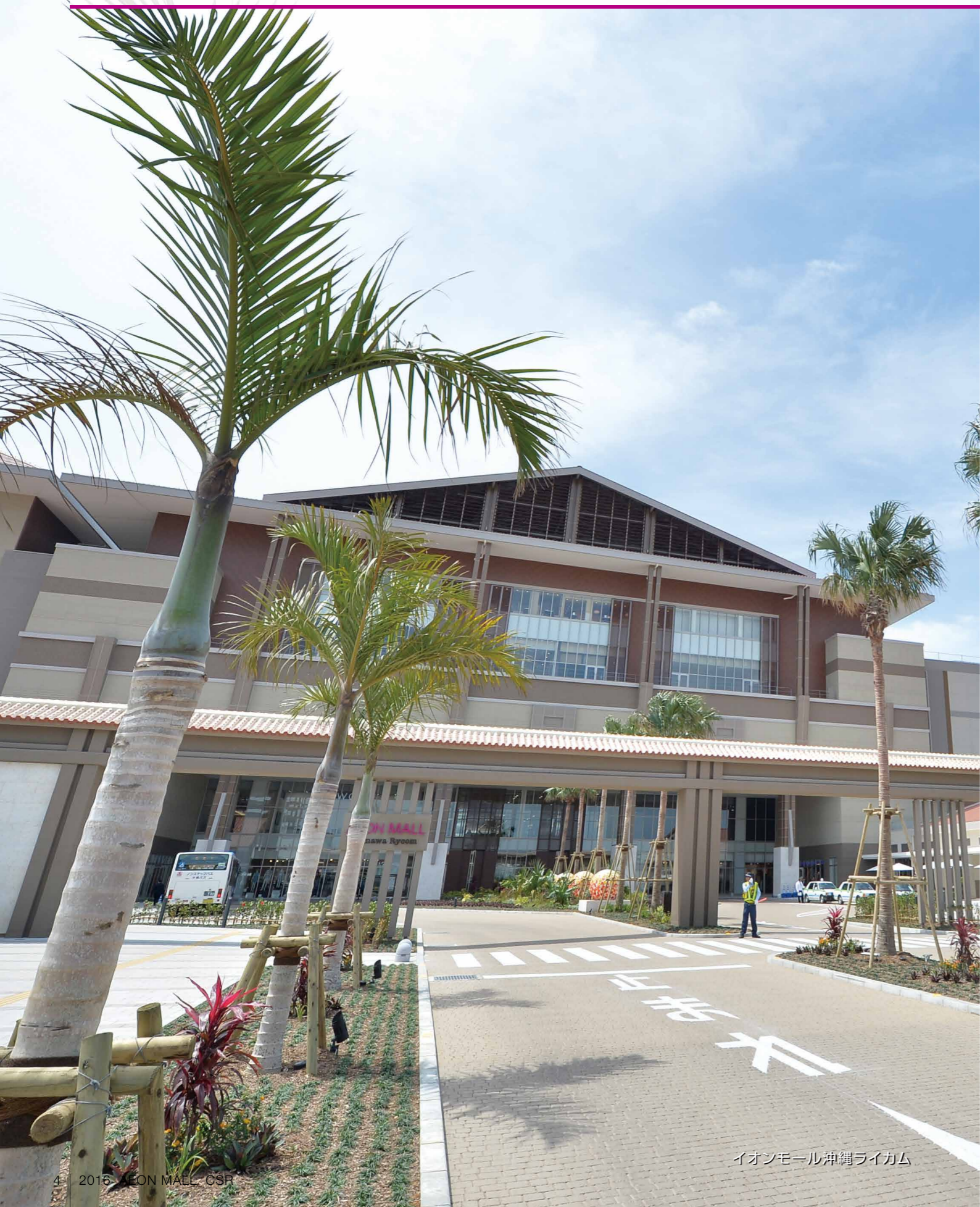
イオンモール沖縄ライカム

イオングループの中核企業として、日本全国、アジアでショッピングモールの開発・運営を進めています。